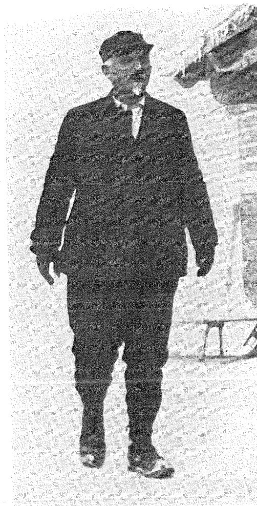
Poslední podobizna z vánoc 1922

( Vnitřní složení oběhu ) Oběh, který zbyl po stažení padesáti — de facto třiceti — procent nekrytého oběhu, odpovídal určité úrovni cen. Rašín byl ovšem přesvědčen, že ji převyšuje, že je zbytečně vysoký. Nyní se však ceny vyvíjely tak, že oněch sedmdesát procent bankovek (proměněných v československé státočky) nikterak jim nepostačovalo. Z pateronásobku šly ceny na patnácteronásobek, ale stát trval na svém závazku a vlastní, nekrytý oběh nezvýšil. Co následovalo? Že výroba a obchod opatřovaly si úvěr lombardem a směnkami, které šly do Bankovního úřadu ministerstva financí, a tam na ně byly vydávány státočky — ale jiné povahy, nikoli nekryté, nýbrž kryté obchodními směnkami. Tato druhá část oběhu a tudíž celkový oběh ovšem stoupal — ale jeho vnitřní složení bylo teď jiné než v době, kdy tu byl pouze sedmimiliardový blok státoček nekrytých. Nyní stoupal oběh, ale tím, že koncem prosince 1919 bylo zde za 80 milionů směnek a za půl miliardy lombardu, rok nato však, koncem prosince 1920, již za více než za dvě miliardy směnek a za 2·3 miliardy lombardu. A k tomu přistupovalo již za půl miliardy devis, za 153 milionů zlata a za čtvrt miliardy valutní půjčky. Opět o rok později, koncem prosince 1921, bylo zde pak za 1·9 miliardy směnek, za 1·7 milionu lombardu, ale za 1·1 miliardy devis a zlata. Vnitřní složení oběhu se tedy