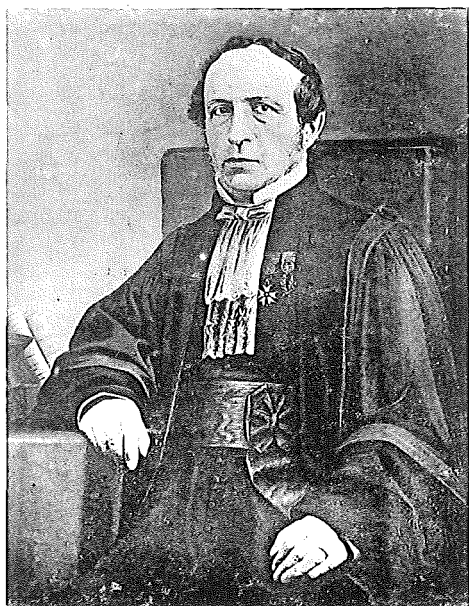
Ch. RAU Professeur à la Faculté de Droit de Strasbourg An XII-1877