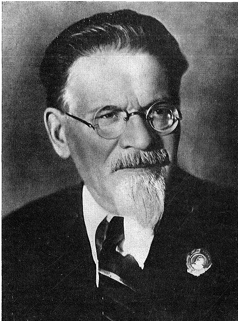
M. I. KALININ

Předseda presidia Nejvyššího sovětu SSSR