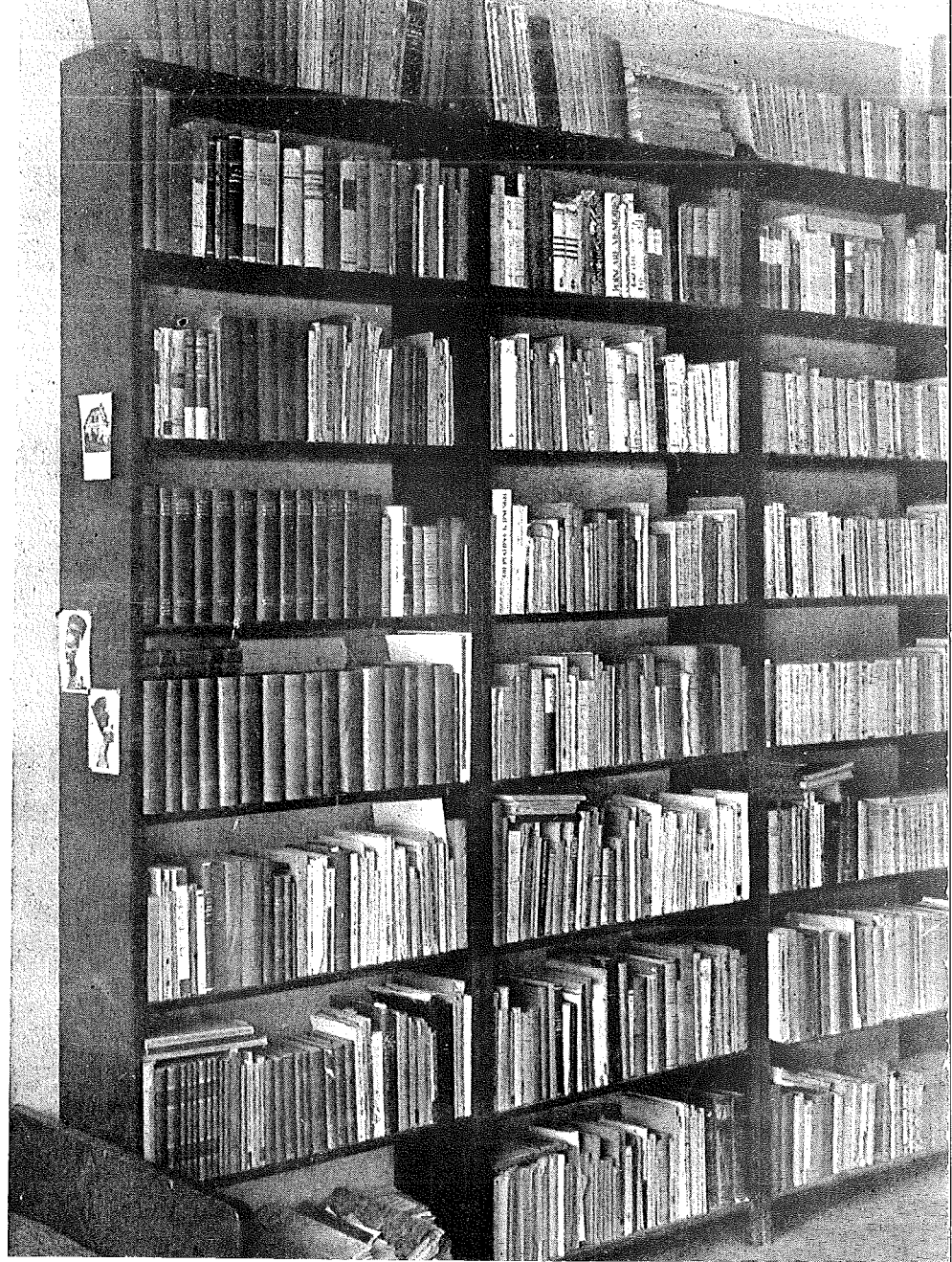
Část knihovny K. Konrada, pokud se zachovala. Podobně jako Fučík neměl Konrad nic než knihovnu, ovšem jednu z nejlepších soukromých marxistických knihoven v předmnichovské Praze.